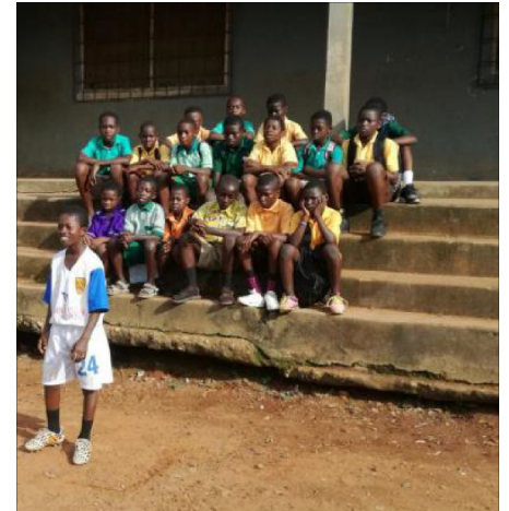
jongeren in Kitase