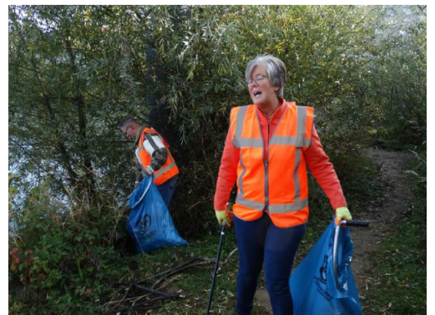
... Kop van de Weerd ...