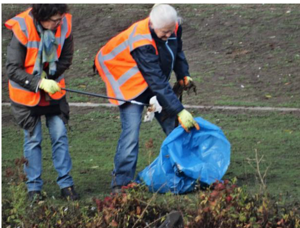
... talud passantenhaven ...