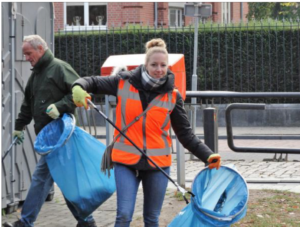
aan de slag: Nolenspark ...