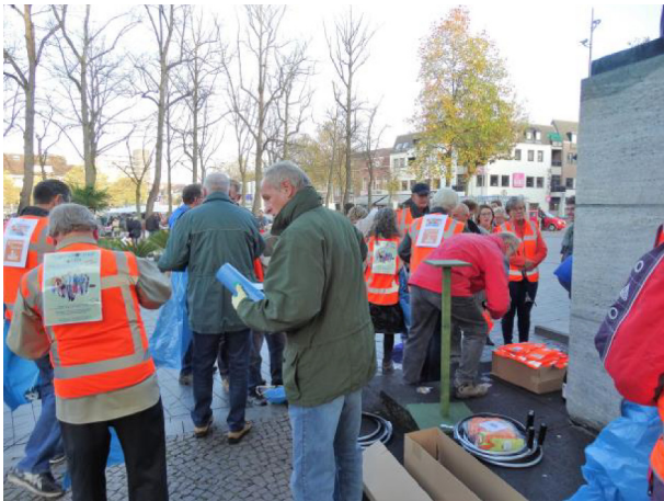
vrijwilligers maken zich op

wijkoverleg Binnenstad Venlo en citymarketing organisatie Venlo Partners betrokken.