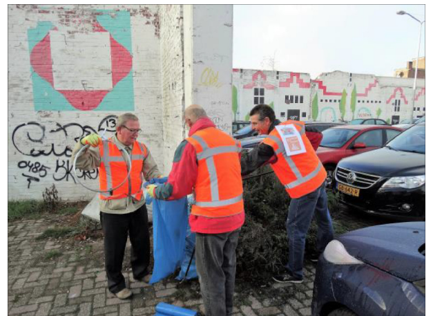
...parkeerplaats achter Beej Benders ....