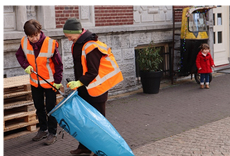
onderweg al bezig

Zo'n 10 vrijwilligers vertrokken vanaf de Jongerenkerk vertrekken naar de diverse bestemmingen, Nolenspark, Kop van Weerd en Koninginnesingel.