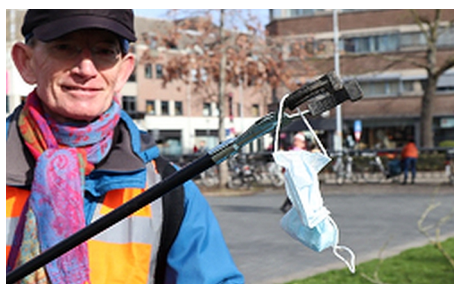
papier. blikjes ... mondkapjes!