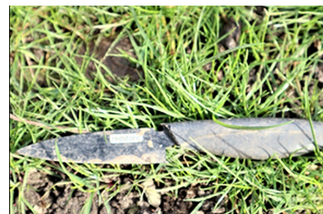
opmerkelijke vondst: een mes!