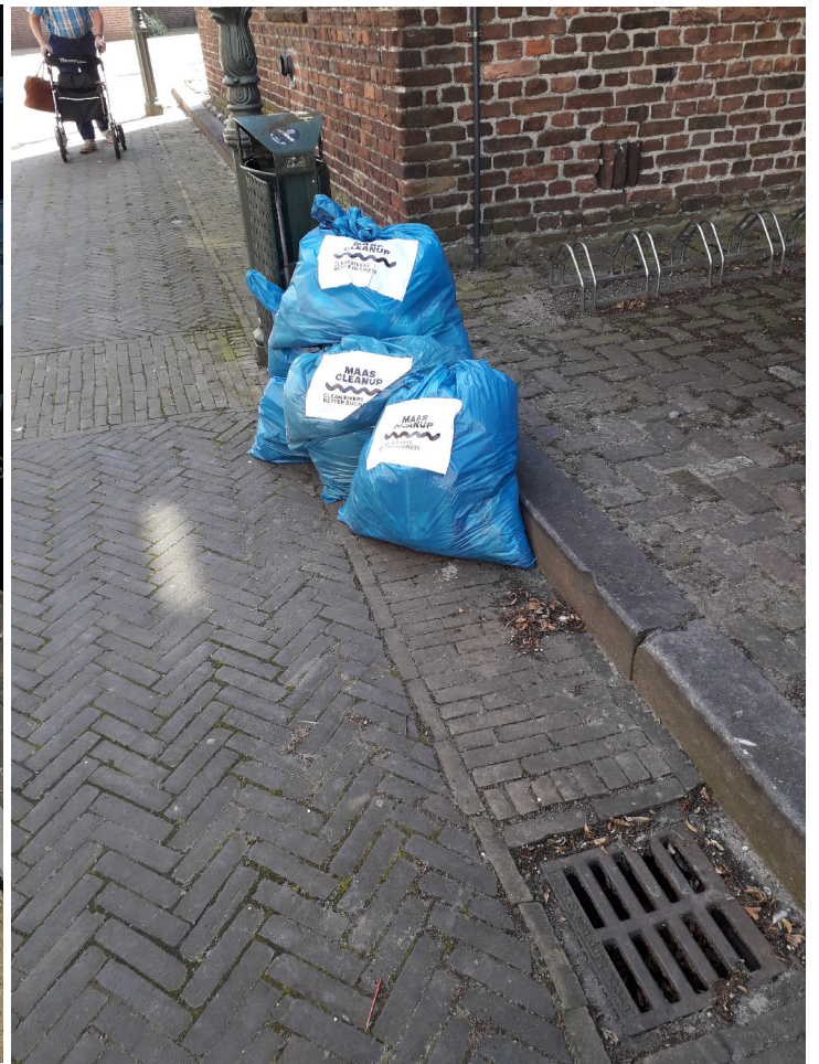
extra Maas Cleanup