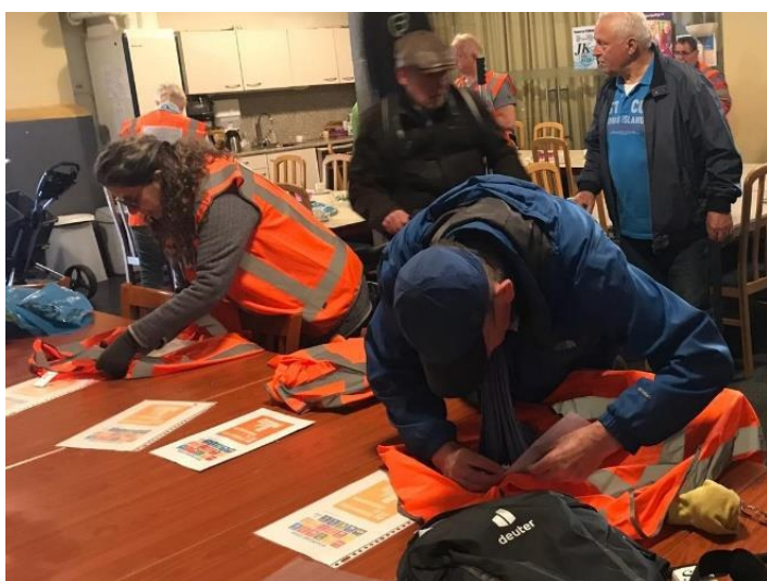
In de Jongerenkerk spelden vrijwilligers actieposters op de hesjes en reiken door de gemeente ter beschikking gestelde materialen uit, zoals grijpers, zakken en handschoenen.

De afgelopen jaren viel het opschonen samen met de jaarlijkse Landelijke Opschoondag en World Clean up Day. Die dagen kregen gelukkig ook in Venlo al veel bijval van Venlo Schoon en bedrijven. Vanaf deze keer kiezen we weer bewust voor een andere datum om de aandacht te spreiden