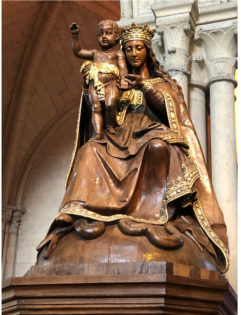
Maria met Kind, Laon (Fr.)

Van daaruit bezochten we prachtige kathedralen, kerken en een kasteel. Noyon, Laon, Soisson, Pierrefonds, Morierval, Saint-Leu-d'Esserent bezochten we vanuit ons eerste onderkomen. Hoewel velen van ons in die plaatsen nog niet eerder waren geweest, verbaasden we ons over de prachtige en reusachtige kathedralen die relatief zo dicht bij elkaar waren gebouwd in een gebied dat nu vooral bestond uit veel natuur en nietige dorpen. Ik ga de gebouwen niet beschrijven. Dat is volstrekt onmogelijk. De meeste waren in de 11 e en 12 e eeuw gebouwd. Dat er nog zo veel beelden en ook glaskunst is bewaard gebleven geeft aan dat daar niet alle kathedralen zijn verwoest in oorlogen en beeldenstorm. We hebben zo veel schoonheid gezien dat ik daar wel een jaar op kan teren.