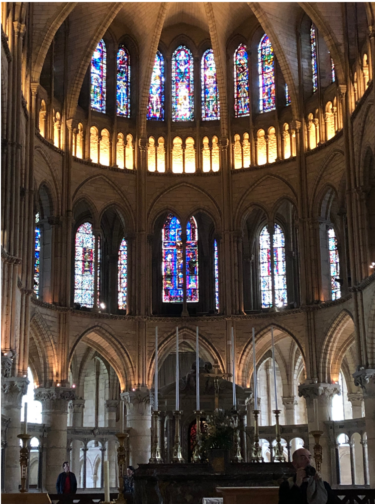
kathedraal Reims (Fr.)

Verder waren er mensen die spontaan in de bus een lezing gaven. Die ging o.a. over architectuur van oude gebouwen, over ziekteverwekkende voedingsmiddelen in de middeleeuwen met gruwelijke gevolgen, over muziek en zang, en over de basilieken in Nederland. Dat waren de algemene extra's. En de bus had koffie/thee, water, bier en wijn ingeslagen, dus aan de basisbehoeften was ruimschoots voldaan! We probeerden individueel met zoveel mogelijk mensen in gesprek te komen, en dat bleek na afloop aardig gelukt te zijn. De reüniebijeenkomst zal waarschijnlijk goed bezocht worden. Een dergelijke reis kan ik eenieder aanbevelen.