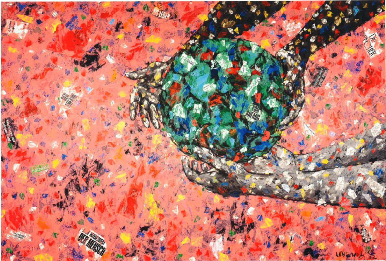
De MISEREOR hongerdoek 2023/2024 'Wat is ons heilig?' van Emeka Udemba © MISEREOR

Zal ze kantelen, zoals ons klimaat aan het kantelen is? Momenten van onderscheiding: De Bijbel vertelt dat God ons de schepping toevertrouwt (Genesis 1-2). Het is een geschenk én een taak. De Schepping is een geschenk dat onder onze verantwoordelijkheid wordt geplaatst. We houden haar in onze handen als het beeld van God. Maar het gaat verder: de Schepping is niet voltooid na zes dagen.