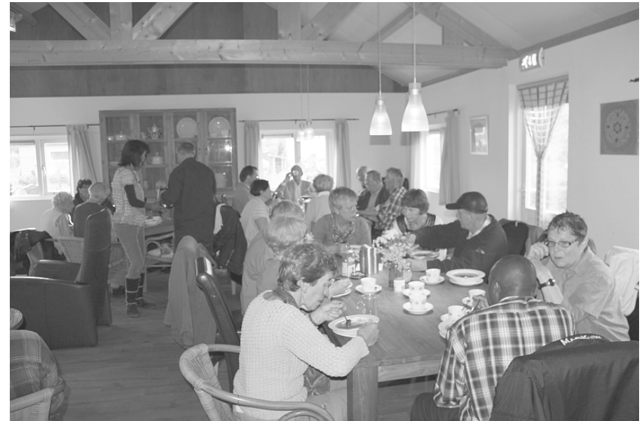
soep met broodjes in zorgboerderij De Wielewaal

Het kaarsje door Hub opgestoken tijdens de dienst voor goed weer tijdens ons jaarlijkse uitstapje, hielp bepaald niet. Je kunt niet zeggen dat het uitstapje is verregend maar nat was het wel.