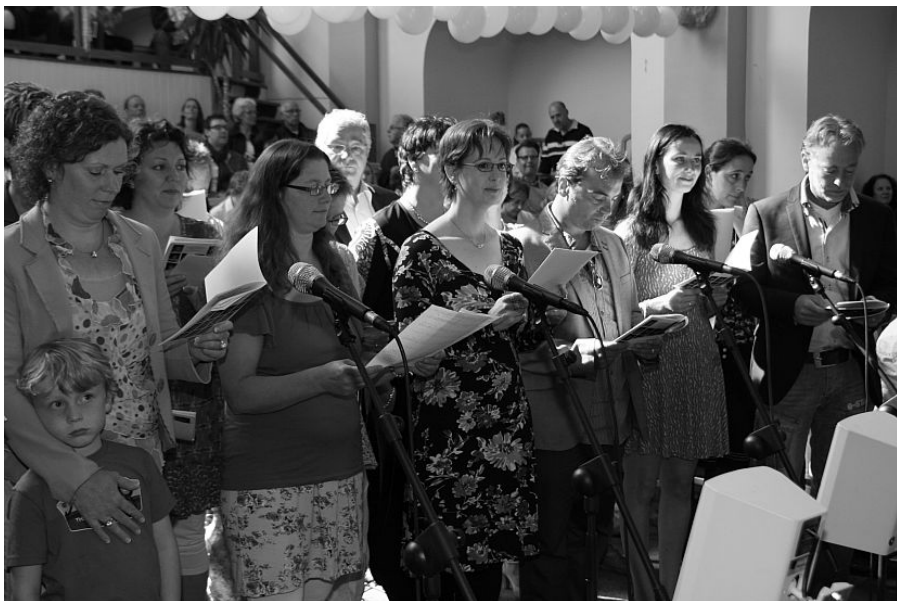
eerste communieviering 2012