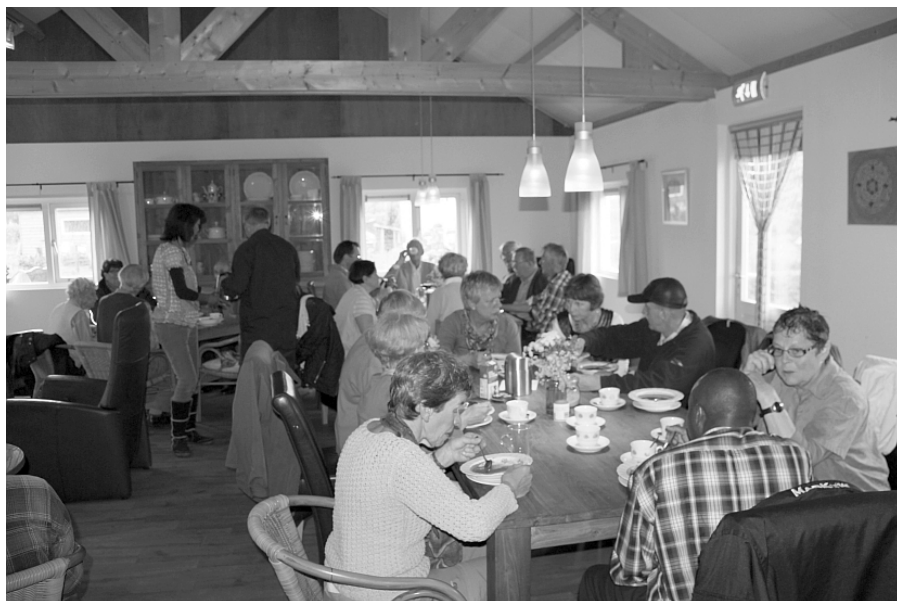
Soep met broodjes in Zorgboerderij de Wielewaal bij het jaarlijkse uitstapje