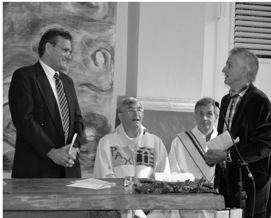
foto's viering 9 september 2012