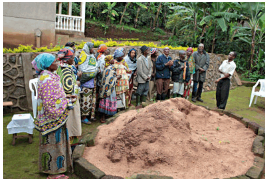
SCC in Tanzania

De leiding van een groep is in handen van een gekozen bestuur: de voorzitter en zijn plaatsvervanger, de assistent, de penningmeester en een secretaris. Elke pastor is de leider van alle SCC's in zijn parochie. Hij bezoekt de groepen regelmatig en viert met hen de eucharistie.