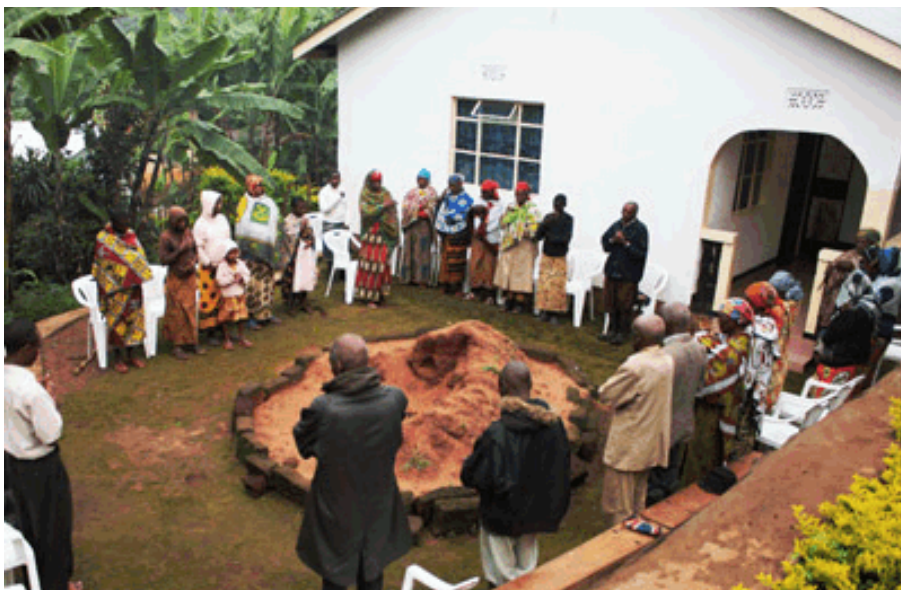
SCC in Tanzania