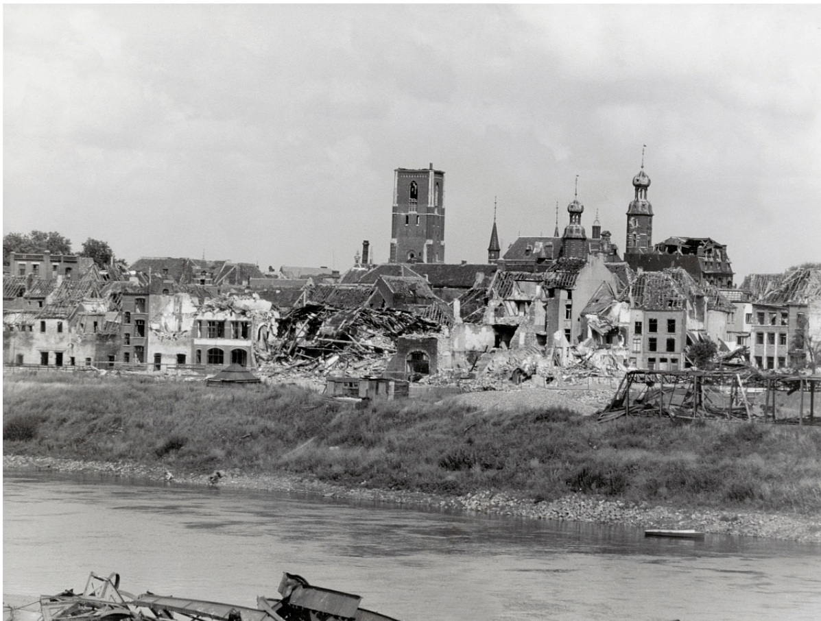
10 juli 1945

www.herdenkingskalender.nl en http://oorlogskelders.nl/